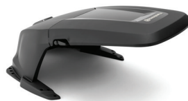
AUTOMOWER® HOUSE L - DOMEČEK PRO AUTOMOWER 597 63 53-01