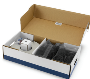
SADA PRO INSTALACI ROBOTICKÉ SEKAČKY, STŘEDNĚ VELKÁ, VČ. ČERNÉHO KABELU ODOLNÉHO PROTI UV 967 97 22-01