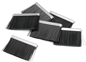
SADA KARTÁČŮ (6 KS) PRO ROBOTICKÉ SEKAČKY 581 98 20-02