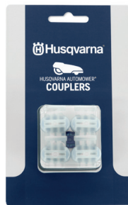
SPOJKA VODIČE SMYČKY, 5 KS 577 86 47-01