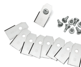
BEZPEČNÉ ŽACÍ BŘÍTY S DLOUHOU ŽIVOTNOSTÍ, 9 KS, UHLÍKOVÁ OCEĽ 577 86 46-03