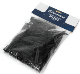
SKOBY PRO VYZNAČENÍ TRÁVNÍKU 577 86 42-01