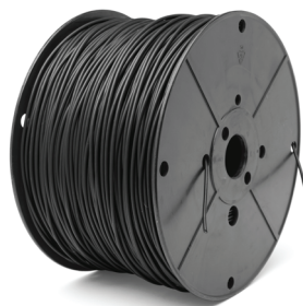
OHRANIČUJÍCÍ VODIČ HEAVY DUTY (VYSOCE ODOLNÝ), Ø 3,4 MM 522 91 41-02