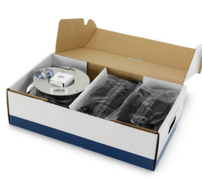
SADA PRO INSTALACI ROBOTICKÉ SEKAČKY HUSQVARNA AUTOMOWER® 967 97 23-01