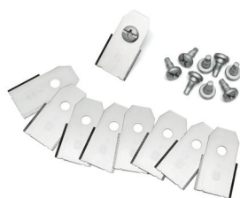
45 KS, UHLÍKOVÁ OCEĽ 0,60 MM 577 60 65-05