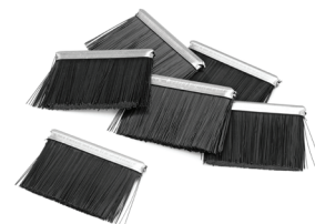
ČISTÍCI KARTÁČKY NA KOLA PRO AUTOMOWER® 505 13 28-03