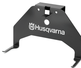
NÁSTĚNNÝ DRŽÁK PRO SEKAČKU AUTOMOWER® 587 22 40-01