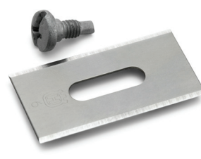
ŽACÍ BŘÍTY AUTOMOWER® ENDURANCE 595 08 44-01