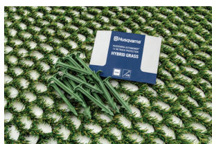
UMĚLÁ TRÁVA 1X1 METR 598 89 60-01