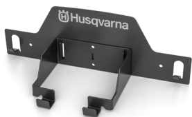
NÁSTĚNNÝ DRŽÁK PRO SEKAČKU AUTOMOWER® 585 01 97-02