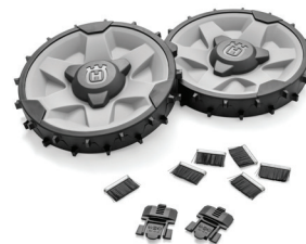
TERÉNNÍ SADA PRO AUTOMOWER® 581 88 97-02