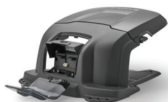
AUTOMOWER® HOUSE L - DOMEČEK PRO AUTOMOWER 585 01 94-01