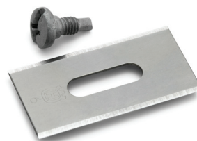
ŽACÍ BŘÍTY AUTOMOWER® ENDURANCE 595 08 44-02