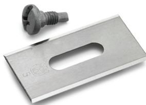
ŽACÍ BŘÍTY AUTOMOWER® ENDURANCE HSS 599 80 52-02