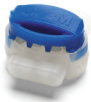
SPOJKA VODIČE 501 98 02-01