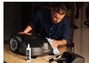
SADA NA ÚDRŽBU ROBOTICKÉ SEKAČKY 590 85 51-01