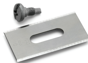
ŽACÍ BŘÍTY AUTOMOWER® ENDURANCE 595 08 44-03