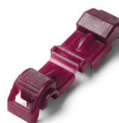
KONEKTOR 535 12 90-01