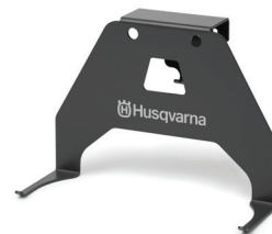
NÁSTĚNNÝ DRŽÁK PRO SEKAČKU AUTOMOWER® 597 70 36-01