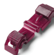
KONEKTOR DO NABÍJECÍ STANICE HUSQVARNA AUTOMOWER® 535 12 90-02