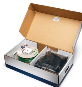
SADA PRO INSTALACI ROBOTICKÉ SEKAČKY 967 62 36-03