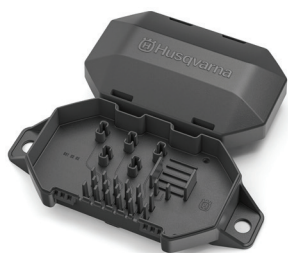
BOX NA OCHRANU KONEKTORŮ PRO AUTOMOWER® 599 80 17-01