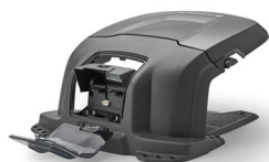
AUTOMOWER® HOUSE L - DOMEČEK PRO AUTOMOWER 587 23 61-01