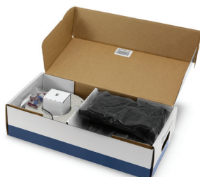
SADA PRO INSTALACI ROBOTICKÉ SEKAČKY, MALÁ, VČ. ČERNÉHO KABELU ODOLNÉHO PROTI UV 967 97 21-01