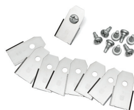
300 KS, UHLÍKOVÁ OCEĽ 0,60 MM 577 60 66-04