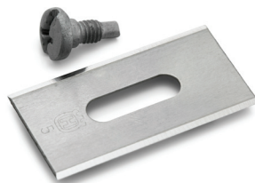
ŽACÍ BŘÍTY AUTOMOWER® ENDURANCE HSS 599 80 52-03