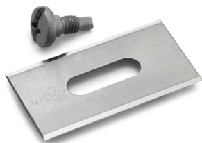
ŽACÍ BŘÍTY AUTOMOWER® ENDURANCE HSS.SADA 6 KS, BLISTER 599 80 52-01