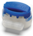
SPOJKA VODIČE, 100 KS 501 98 02-03