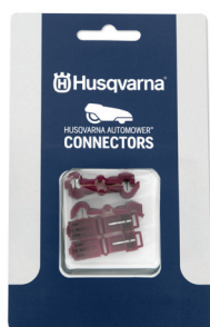
KONEKTOR PRO OHRANIČUJÍCÍ/NAVÁDĚCÍ VODIČE, 5 KS, BALENÍ BLISTR 577 86 48-01