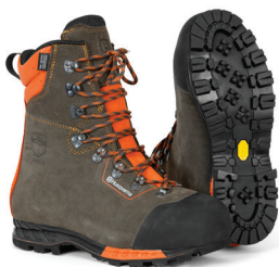
OCHRANNÁ KOŽENÁ OBUV FUNCTIONAL S OCHRANOU PROTI PROŘÍZNUTÍ 24 M/S 597 65 93-39