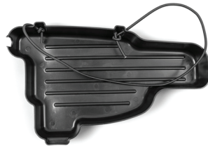
PODLOŽKA POD ŘETĚZOVOU PILU HUSQVARNA 536 94 48-02