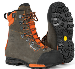
OCHRANNÁ KOŽENÁ OBUV FUNCTIONAL S OCHRANOU PROTI PROŘÍZNUTÍ 24 M/S 597 65 93-38