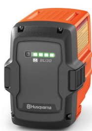
AKUMULÁTOR HUSQVARNA BLI30 967 93 77-01