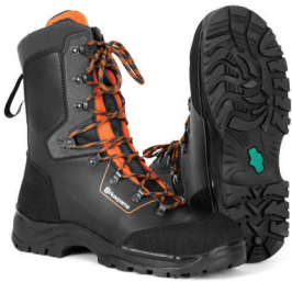
OCHRANNÁ KOŽENÁ OBUV CLASSIC S OCHRANOU PROTI PROŘÍZNUTÍ 597 65 94-46