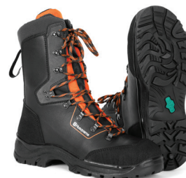
OCHRANNÁ KOŽENÁ OBUV CLASSIC S OCHRANOU PROTI PROŘÍZNUTÍ 597 65 94-45