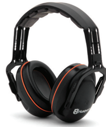
CHRÁNIČE SLUCHU 505 66 53-04