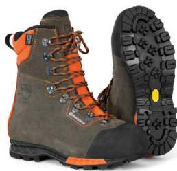
OCHRANNÁ KOŽENÁ OBUV FUNCTIONAL S OCHRANOU PROTI PROŘÍZNUTÍ 24 M/S 597 65 93-44