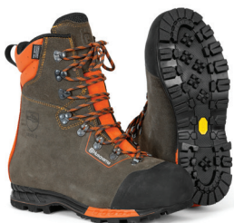
OCHRANNÁ KOŽENÁ OBUV FUNCTIONAL S OCHRANOU PROTI PROŘÍZNUTÍ 24 M/S 597 65 93-47