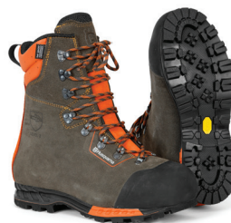
OCHRANNÁ KOŽENÁ OBUV FUNCTIONAL S OCHRANOU PROTI PROŘÍZNUTÍ 24 M/S 597 65 93-41