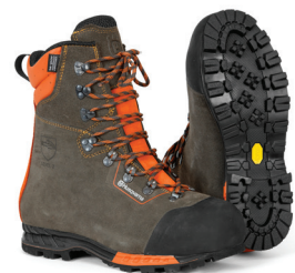
OCHRANNÁ KOŽENÁ OBUV FUNCTIONAL S OCHRANOU PROTI PROŘÍZNUTÍ 24 M/S 597 65 93-42