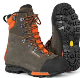
OCHRANNÁ KOŽENÁ OBUV FUNCTIONAL S OCHRANOU PROTI PROŘÍZNUTÍ 24 M/S 597 65 93-46