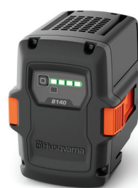
AKUMULÁTOR HUSQVARNA 40-B140 970 45 72-01