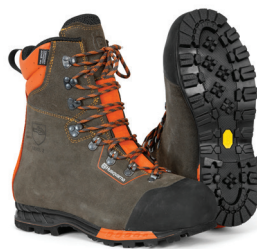
OCHRANNÁ KOŽENÁ OBUV FUNCTIONAL S OCHRANOU PROTI PROŘÍZNUTÍ 24 M/S 597 65 93-45