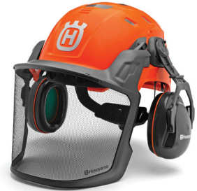
OCHRANNÁ PŘILBA PRO PRÁCI V LESE, TECHNICAL 585 05 84-01