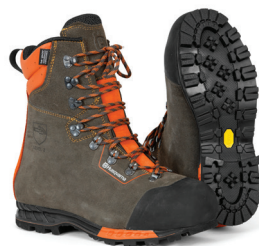
OCHRANNÁ KOŽENÁ OBUV FUNCTIONAL S OCHRANOU PROTI PROŘÍZNUTÍ 24 M/S 597 65 93-40