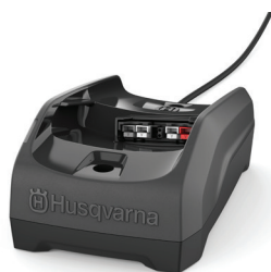
NABÍJEČKA HUSQVARNA 40-C80 970 48 78-01