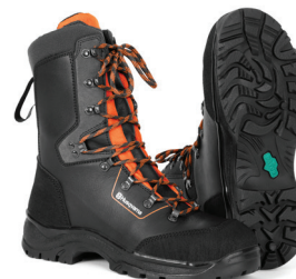
OCHRANNÁ KOŽENÁ OBUV CLASSIC S OCHRANOU PROTI PROŘÍZNUTÍ 597 65 94-41