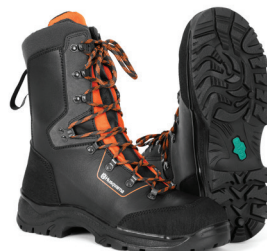
OCHRANNÁ KOŽENÁ OBUV CLASSIC S OCHRANOU PROTI PROŘÍZNUTÍ 597 65 94-40