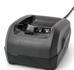
NABÍJEČKA HUSQVARNA QC250 967 97 01-01