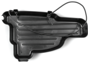
PODLOŽKA POD ŘETĚZOVOU PILU HUSQVARNA 536 94 48-01