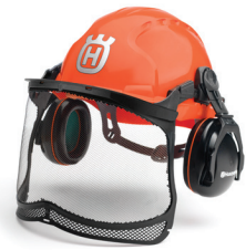
OCHRANNÁ PŘILBA PRO PRÁCI V LESE, CLASSIC 580 75 43-01