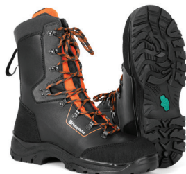
OCHRANNÁ KOŽENÁ OBUV CLASSIC S OCHRANOU PROTI PROŘÍZNUTÍ 597 65 94-39