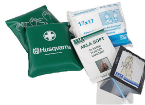
LÉKÁRNIČKA PRVNÍ POMOCI 504 09 53-01