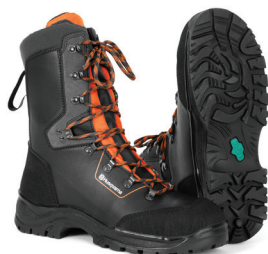
OCHRANNÁ KOŽENÁ OBUV CLASSIC S OCHRANOU PROTI PROŘÍZNUTÍ 597 65 94-43