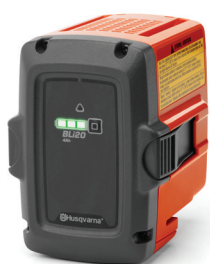
AKUMULÁTOR HUSQVARNA BLI20 967 09 17-01