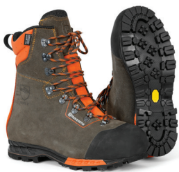
OCHRANNÁ KOŽENÁ OBUV FUNCTIONAL S OCHRANOU PROTI PROŘÍZNUTÍ 24 M/S 597 65 93-43