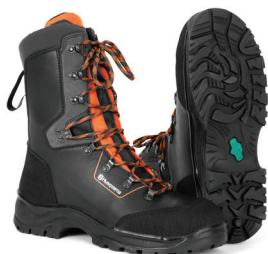
OCHRANNÁ KOŽENÁ OBUV CLASSIC S OCHRANOU PROTI PROŘÍZNUTÍ 597 65 94-42