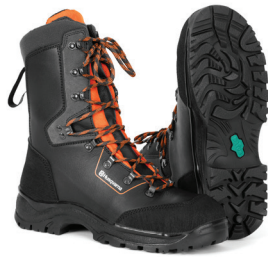
OCHRANNÁ KOŽENÁ OBUV CLASSIC S OCHRANOU PROTI PROŘÍZNUTÍ 597 65 94-47