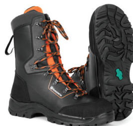
OCHRANNÁ KOŽENÁ OBUV CLASSIC S OCHRANOU PROTI PROŘÍZNUTÍ 597 65 94-44