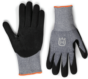
RUKAVICE TECHNICAL GRIP 529 88 03-07